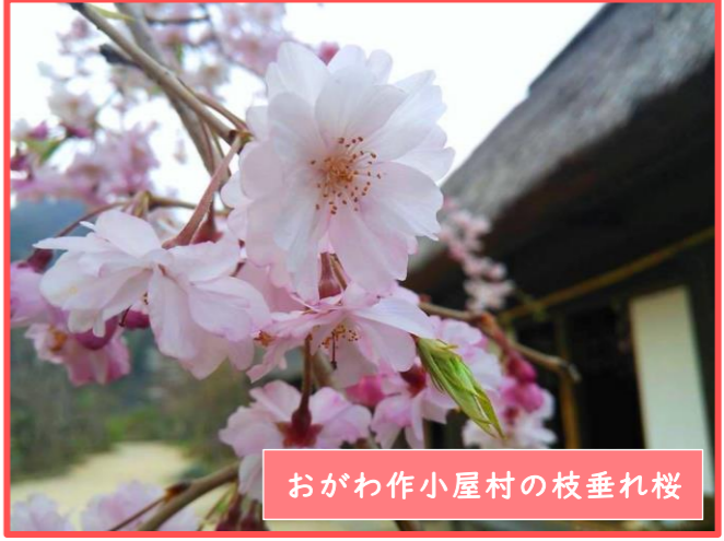
おがわ作小屋村の枝垂れ桜