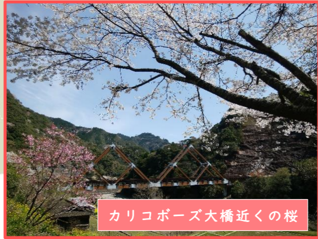
カリコポーズ大橋近くの桜