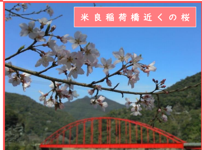
米良稻荷橋近くの桜