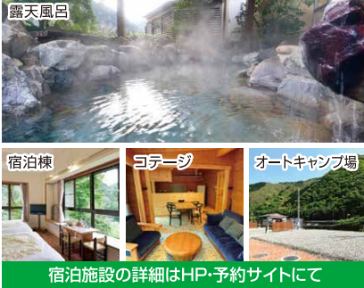
宿泊施設の詳細はHP・予約サイトにて

お肌をつるつるにすると評判の美人の湯、「西米良温泉ゆた〜と」には、温泉や食事はもちろん、館内に「宿泊棟」があり、隣接する「双子キャンプ村」にはオートキャンプ場が登場し、さらにプレミアムコテージが新設！宿泊の選択肢が増え、様々な用途での滞在が可能です。詳しい情報はHP、予約サイトにて。