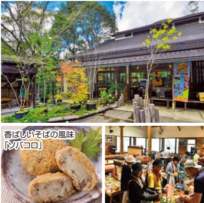
香ばしいそばの風味「そばコロ」

西米良の東の玄関口と言われ、店内から眺望できる一ツ瀬ダムでは釣りも楽しめます。蕎麦がきに、椎茸、筍が入った人気の「そばコロ」は揚げたてはもちろん冷めても美味しく、オススメです。店内には西米良の旬が味わえる食堂もあり、猪ソバや名物のチャンポンなども楽しめます。